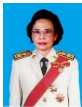
ศาสตราจารย์เกียรติคุณ ดร.สมจิต หนูเจริญกุล