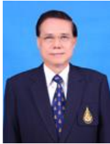
ศาสตราจารย์ไชยยศ เหมะรัชตะ