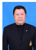
พลตำรวจเอก ดร.ประสาน วงศ์ใหญ่