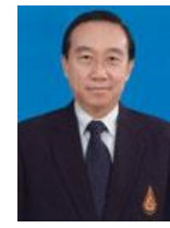
ศาสตราจารย์พิเศษ สมชาย พงษา