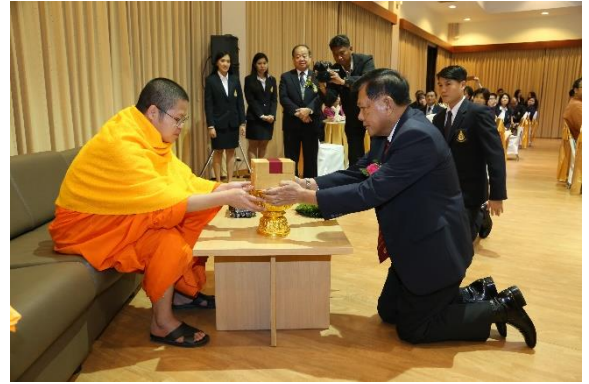
งานเลี้ยงรับรองเพื่อเป็นเกียรติแก่ผู้ได้รับพระราชทานปริญญา ดุษฎีบัณฑิตกิตติมศักดิ์ ปีการศึกษา 2557 และรางวัลเชิดชูเกียรติ “ตุงทองคำ” เมื่อวันที่ 8 กุมภาพันธ์ 2559